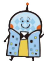
海峡ゆめタワーイメージキャラクター「ゆめたん」